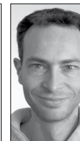
Eelco Mulder PR

De taken en verantwoordelijkheden van de wedstrijdcommissie hangen af van het soort wedstrijd. Bij de ene wedstrijd is de commissie meer betrokken dan bij de andere.