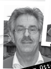
Ad den Otter